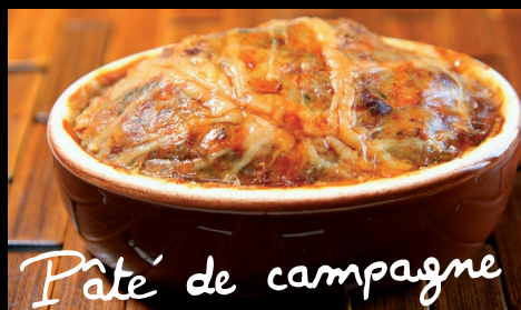
Pâté de campagne